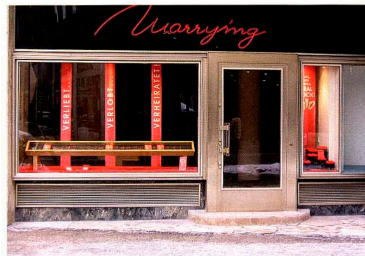
Zentrale Lage in Münchens Shopping-Meile: der Trauringladen „Marrying“

Standorte: Berlin, Köln, München und Münster Angebot: je 160 Trauring-Paare in Platin und Gold mit vielen Variations-Möglichkeiten Preise: 400 bis 7000 Euro Extras: 1 Gratis-Hotelübernachtung mit Frühstück für alle Paare, die ihre Trauringe dort kaufen (Mindestpreis: 600 Euro pro Paar) Infos: www.marrying.de