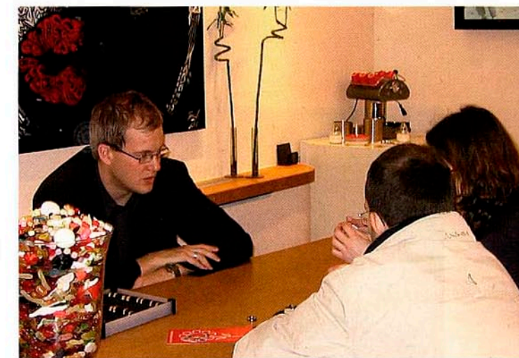
Welchen Ring sollen wir bloß nehmen? Beratungsgespräch am langen Holz-Tisch

hier ihre Trauringe gekauft. Zum Beispiel „Tatort“-Gerichtsmediziner Jan Josef Liefers und Anna Loos. Doch das Attribut „Promi-Juwelier“ hört man nicht gerne. Klingt teuer und abgehoben. Das ist „Marrying“ nicht. Die Trauringe gibt's in allen Preislagen – von 400 bis 7000 € je Paar.