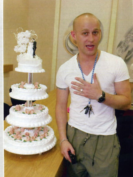
▲ Überraschend konservativ gab sich der verheiratete Schauspieler Jürgen Vogel: „Für mich haben die Ehe und der dazugehörige Ring eine wichtige und ernst zu nehmende Bedeutung“